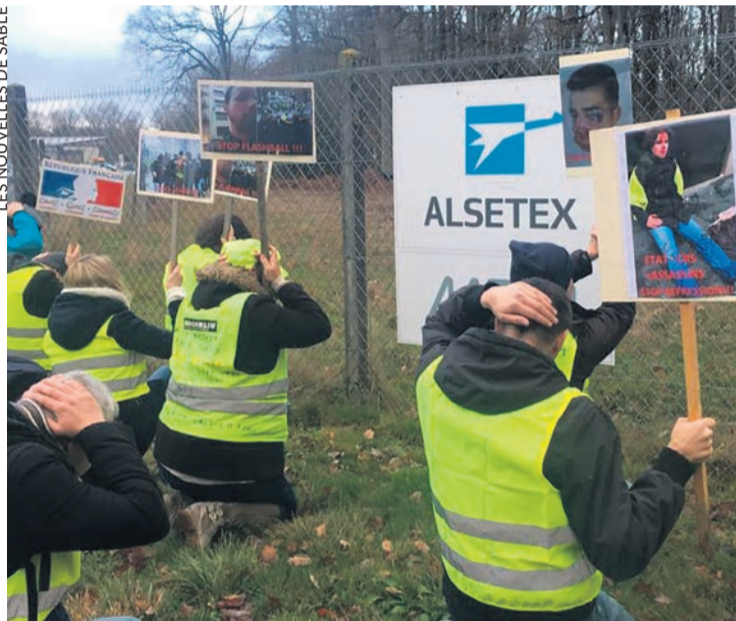
Manifestation contre la répression devant l'usine Alsetex de Précigné.