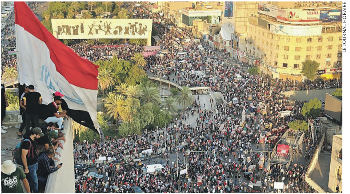
En octobre, sur la place Tahir, à Bagdad.

de mal en pis: 90% des gens n'ont pas de véritable emploi ici », accusait un ouvrier de la banlieue ouvrière de Bagdad, qui compte trois millions d'habitants. Le chômage frappe en particulier nombre de jeunes qui s'étaient engagés pour combattre contre l'organisation État islamique et qui se retrouvent aujourd'hui sans avenir. La colère, qui s'est exprimée à plusieurs reprises ces dernières années, est dirigée contre le