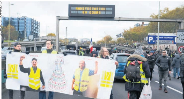
La manifestation du 16 novembre.

L'attention des médias s'est à nouveau polarisée sur les échauffourées en marge du rassemblement parisien, taisant les raisons qui, depuis des mois, font descendre des milliers de gens dans la rue malgré les brutalités policières.