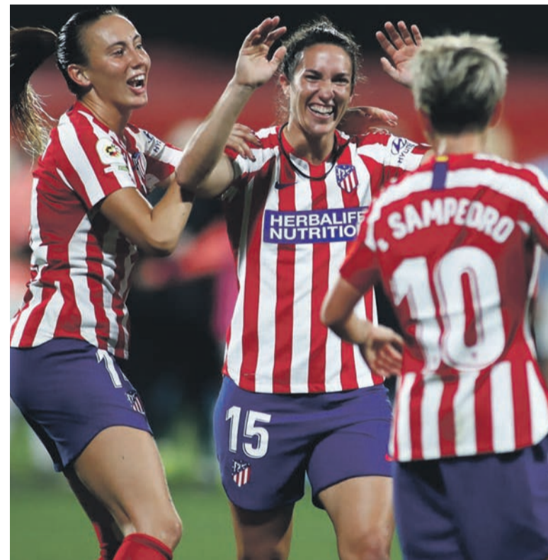
Les footballeuses de l'Atletico Madrid.