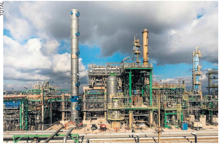
La raffinerie de La Mède.