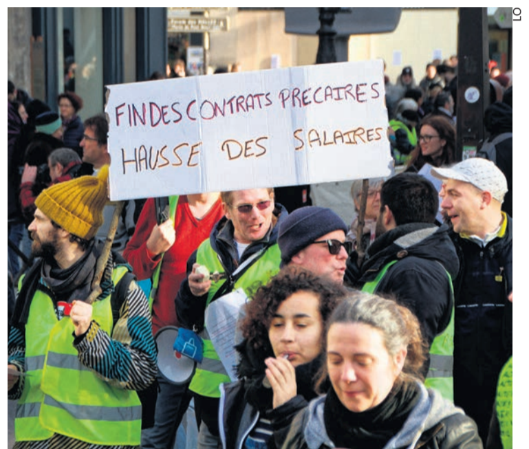
Manifestation CGT-Gilets jaunes en février 2019.

Pour résoudre les problèmes de fin de mois, il faudrait une augmentation générale des salaires, la réduction du chômage par l'embauche des précaires, l'interdiction des suppressions de postes et des licenciements dans les grands groupes et leurs sous-traitants. Ces revendications ne peuvent être que celles des travailleurs, organisés et en lutte pour les intérêts de l'ensemble de leur classe sociale. Or les travailleurs qui ont participé au mouvement des gilets jaunes, ou l'ont soutenu, l'ont fait en tant qu'individus, en dehors des