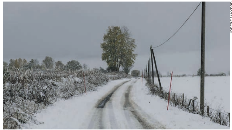
15 novembre 2019.