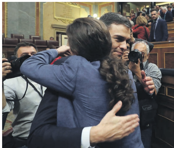
Sanchez et Iglesias s'entendent... sur le dos des travailleurs.

Dans les entreprises et dans les cafés, les mêmes questions reviennent dans les discussions : « Pourquoi n'ont-ils pas pu le faire avant ? Pourquoi ont-ils