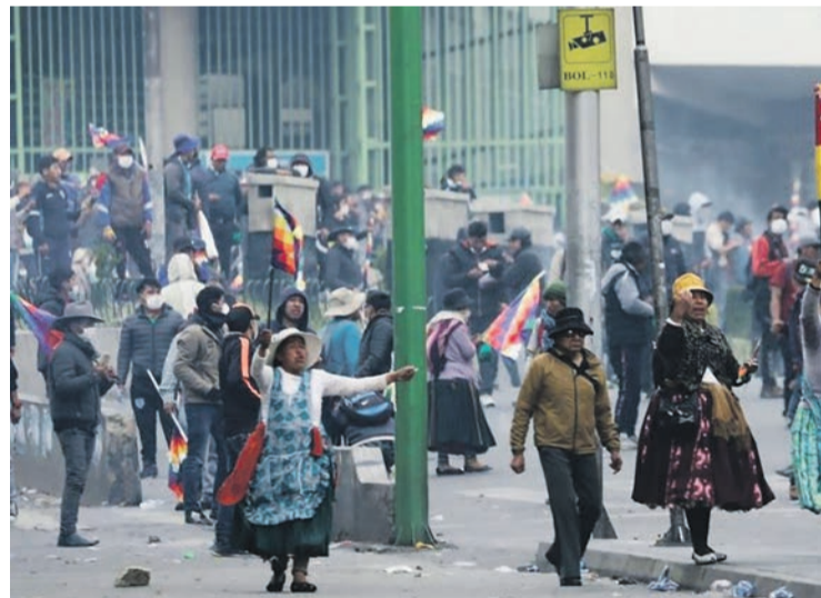
Après l'autoproclamation d'Añez, manifestation pro-Morales à La Paz.