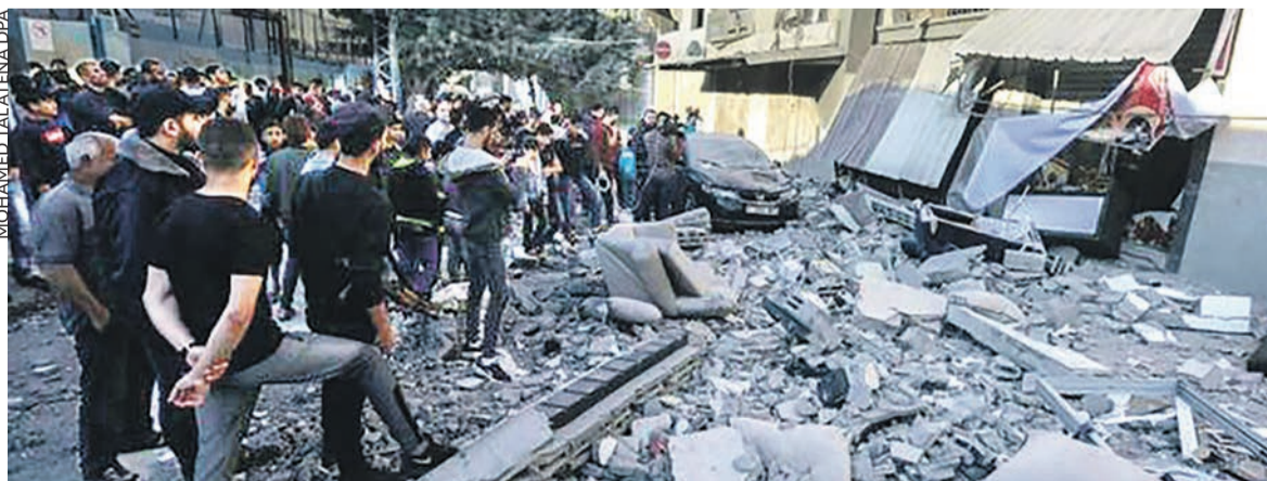
Le résultat d'un « tir ciblé » de l'armée israélienne sur Gaza, le 12 novembre.