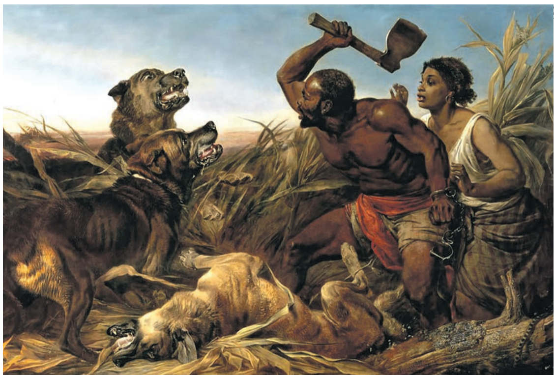
Esclaves pris en chasse. Richard Ansdell, 1862.