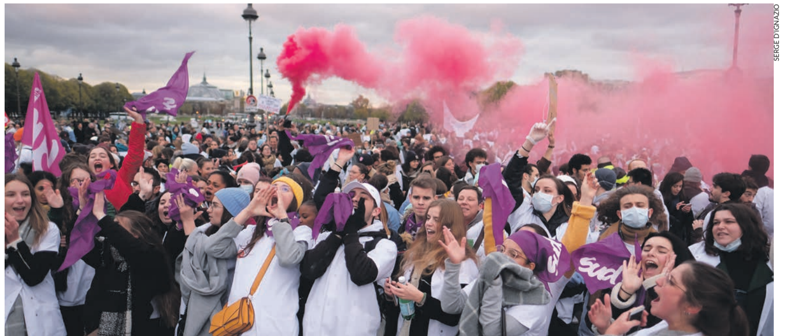
Manifestation des hospitaliers le 14 novembre.

Nous nous ferons craindre du gouvernement si nous sommes unis et déterminés. Retrouvons confiance dans nos forces collectives ! Faisons-nous respecter ! Le 5 décembre, tous en grève et en manifestation !