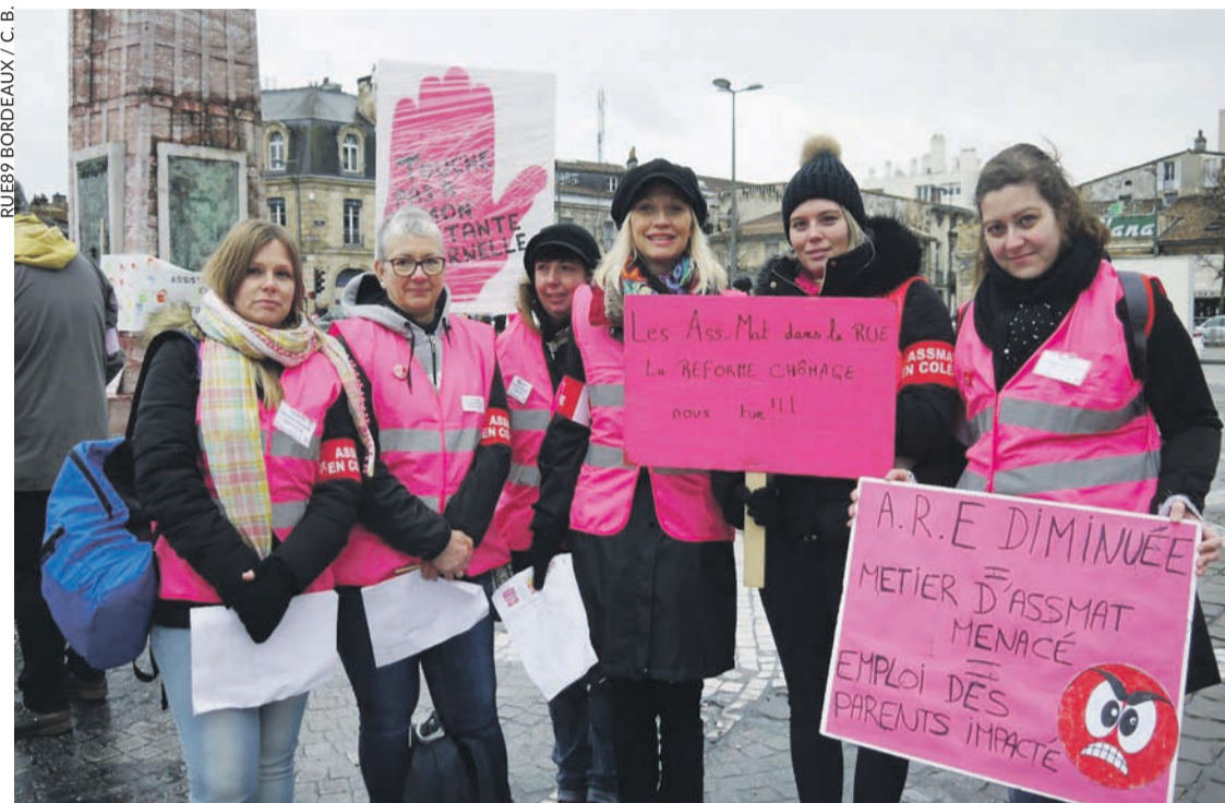
Manifestantes à Bordeaux.