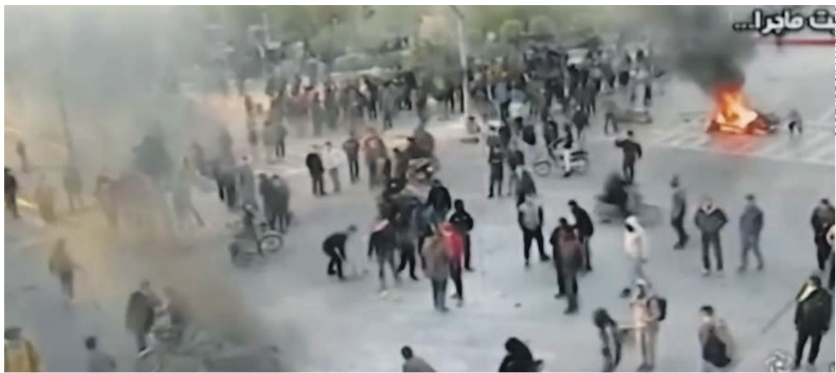
Téhéran, le 16 novembre.