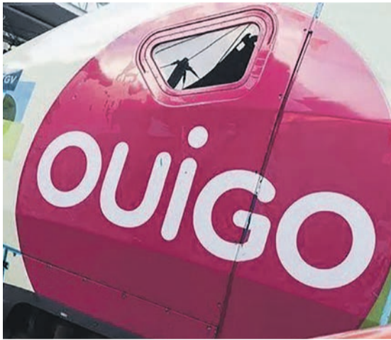
Des anciens Corails aux nouveaux Ouigos... un transport au rabais.

La SNCF vient d'officialiser le lancement de son projet de trains Intercités à bas coût et à petite vitesse. Au printemps 2022, sur les lignes Paris-Lyon et Paris-Nantes, elle a annoncé des billets dans une fourchette de 10 à 30 euros maximum.