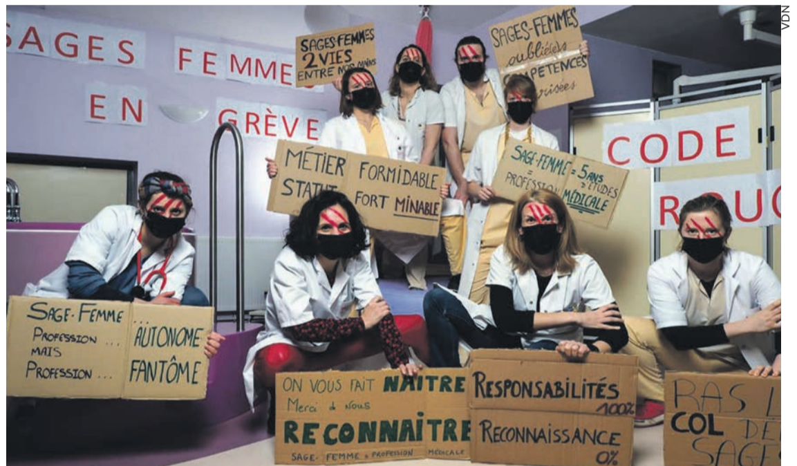
Grévistes à Lens.

Mais ce que l'on a surtout pu entendre au travers des témoignages diffusés lors de ces journées de grève, c'est, comme pour l'ensemble du personnel médical, la lassitude et la colère ressenties