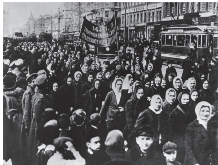
En 1917, manifestation à Pétrograd pour la journée internationale des femmes.

Le Parti bolchevique mena une lutte militante pour davantage impliquer les femmes dans l'action politique. Lénine soulignait