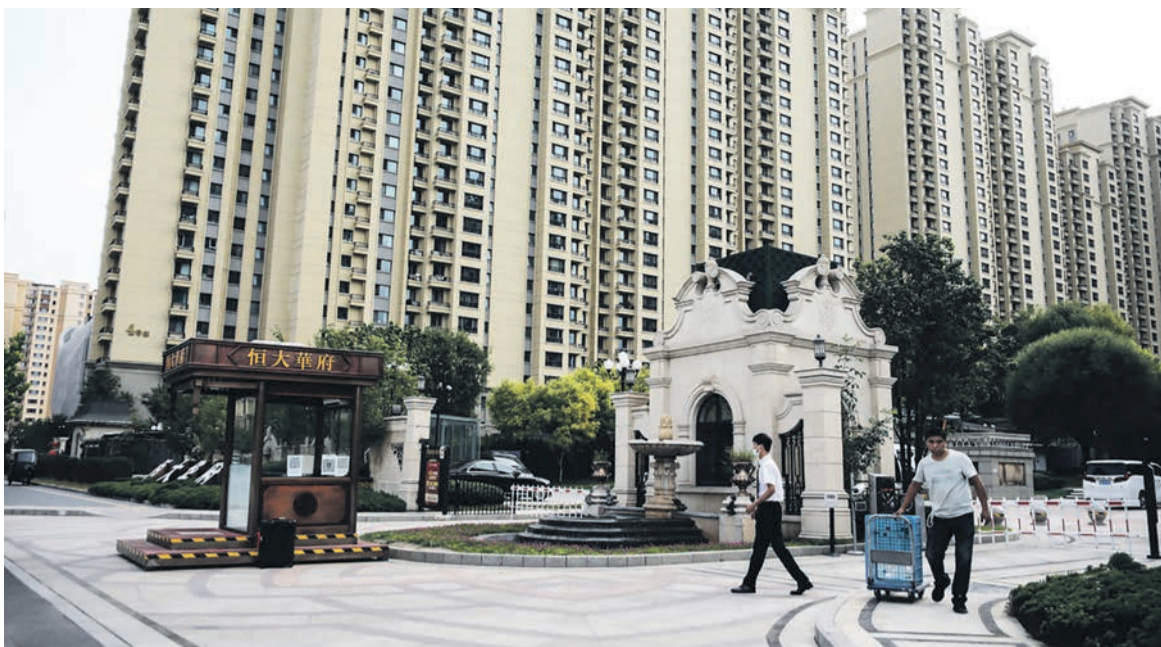
À Suzhou, une ville proche de Shanghai, un complexe immobilier d'Evergrande laissé à l'abandon.

La spéculation immobilière n'a pas fait la fortune de capitalistes chinois. Après la crise de 2009 et le plan de relance massif de l'État, nombre d'entreprises occidentales se sont tournées vers ce qui était présenté