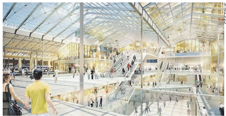
Une gare... ou un grand centre commercial ?

En effet, la SNCF entend tout d'abord rentabiliser ces Intercités comme les TGV Ouigo, par une maintenance 24 heures sur 24 et sept jours sur sept, ce qui se traduit par la multiplication des horaires décalés et de nuit dans les ateliers d'entretien. Et elle entend basculer les cheminots, conducteurs comme contrôleurs, dans une filiale baptisée Oslo, spécifiquement créée pour la circulation de ces Intercités low-cost. Les conditions de travail y seront bouleversées en multipliant les tâches des roulants de façon à supprimer l'emploi des autres personnels. En plus de la conduite, les conducteurs devront par exemple assurer l'accrochage des trains et leur manœuvre dans les dépôts, les essais de frein, la prise