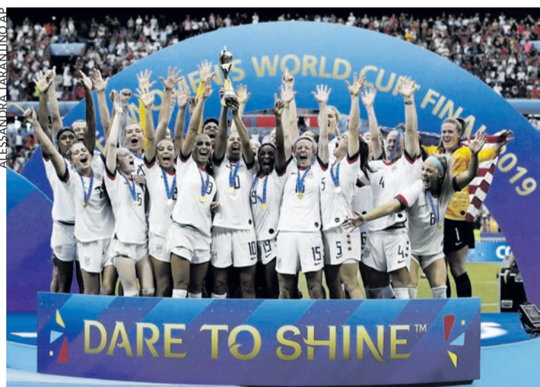
L'équipe américaine de football championne du monde en 2019.

Les footballeuses américaines ont enfin obtenu de toucher les mêmes primes que les joueurs. et non trois fois moins. Pourtant, l'équipe masculine n'a jamais dépassé les quarts de finale d'un Mondial, alors que l'équipe féminine a tout gagné, notamment quatre Coupes du monde (dont la dernière, en 2019) et quatre titres olympiques.