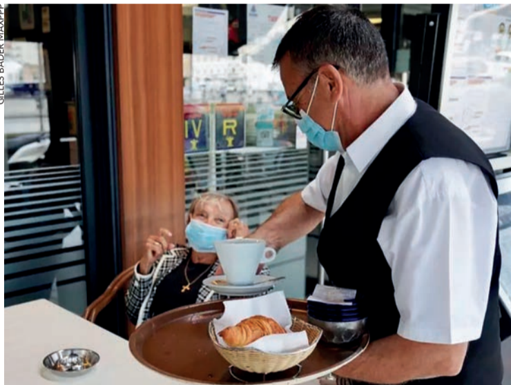
Les pourboires défiscalisés... ou de vraies augmentations de salaires.