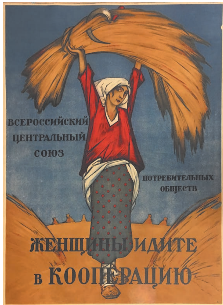
Ignati Nivinski : affiche de propagande du Jenotdel. « Femmes allez à la coopérative. »