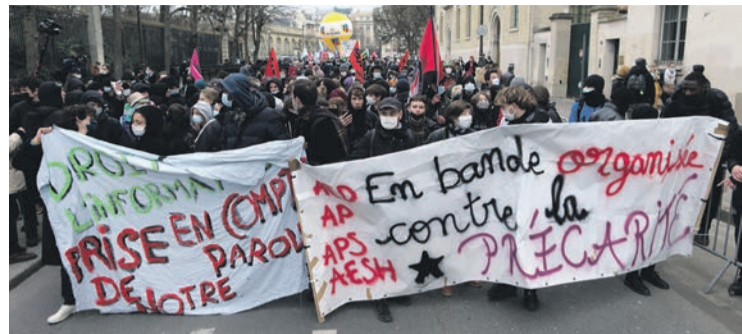
Manifestation contre la précarité, le 26 janvier 2021.

Au bout de six ans, un contractuel peut espérer décrocher un CDI mais ce sont justement ceux qui sont proches du but qui parfois ne retrouvent pas de travail. Et il suffit de quatre mois d'interruption pour devoir recommencer le parcours du combattant. Pour les contractuels immigrés, la pression est encore