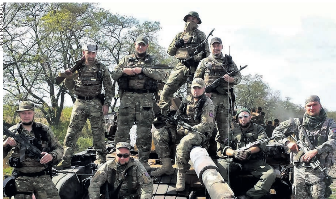
Des mercenaires de Wagner.