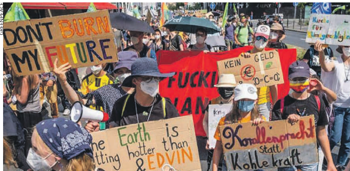
Manifestation pour le climat en Allemagne.