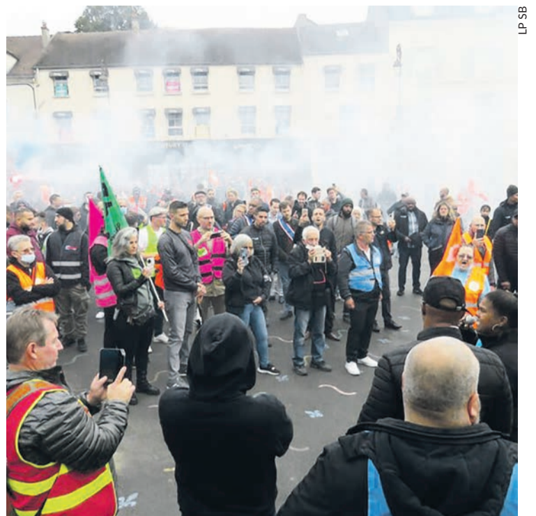
Manifestation de soutien aux grévistes à Melun, le 27 septembre.

La grève exerce une pression, et certains élus locaux s'en prennent à Péresse, présidente d'IDFM. Celle-ci répond que l'organisation du travail dépend des employeurs, et eux-mêmes mettent en avant qu'IDFM ne leur laisse pas le choix