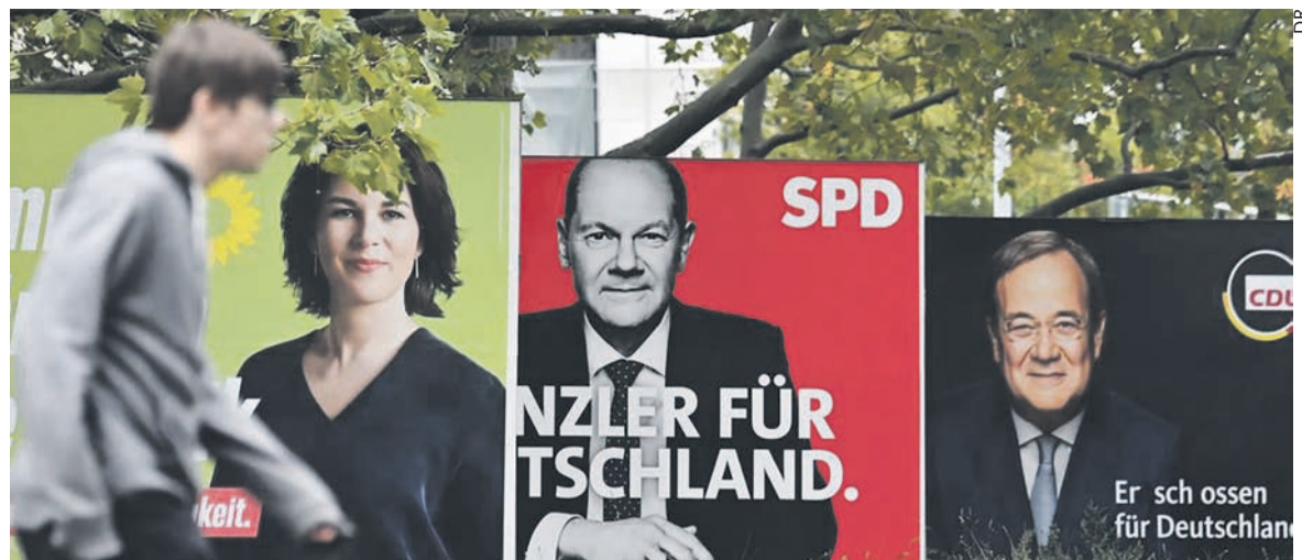
Trois des candidats à la chancellerie sur les affiches de leur parti.

L'AfD (Alternative für Deutschland, extrême droite), entrée avec fracas au Bundestag pour la première fois en 2017, recule un peu, passant de 12,6 % des voix à 10,3 %. Mais cela confirme un enracinement à un niveau inégalé depuis l'après-guerre. La question des migrants n'étant heureusement guère présente dans le débat,