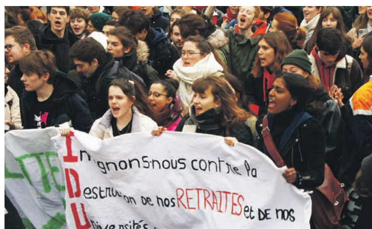
Dans la rue contre le projet de Macron, en 2020.

En fait, les gouvernements, de droite comme de