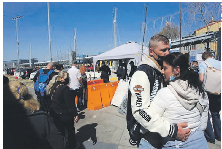
Réfugiés russes à la frontière mexicaine.