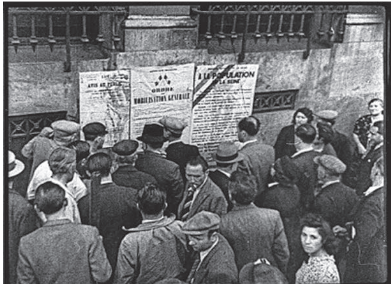
Appel à la mobilisation générale en septembre 1939, en France.