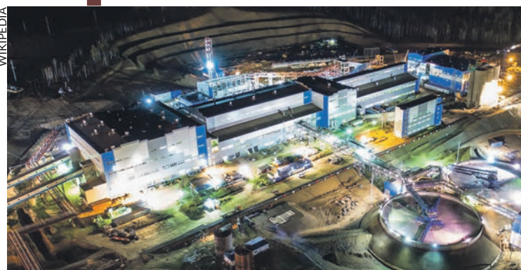
Le complexe de Nornickel à Bystrinsky en Russie.

Depuis le début de l'offensive russe, les prix de nombreuses matières premières comme le pétrole, le gaz, le blé, l'acier, l'uranium, atteignent des records historiques.