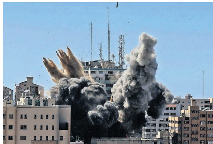
Bombardement israélien à Gaza en mai 2021.

Usant de la même propagande mensongère que ses prédécesseurs, Biden cherche à redorer auprès de sa population l'image du gouvernement américain,