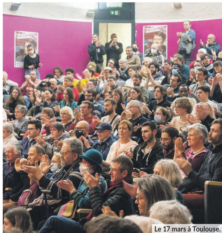
Le 17 mars à Toulouse.