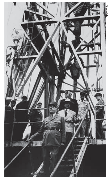
En 1957, visite de De Gaulle aux puits de pétrole de Hassi Messaoud.

Soixante ans après, des commémorations ont lieu de part et d'autre de la Méditerranée. L'indépendance chèrement acquise a permis à tout un peuple de retrouver sa dignité. En Algérie, le pouvoir continue à se servir de la guerre d'indépendance pour se légitimer. Or, même si la victoire contre l'ancienne puissance coloniale représente encore une fierté, les classes populaires rejettent massivement le système politique qui s'est installé. Elles l'ont exprimé en 2019, lors du Hirak, ce mouvement populaire qui a secoué le pays. Le pouvoir auquel elles se