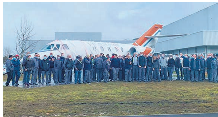
Un Falcon emballé dans du papier toilette par les grévistes de Martignas.