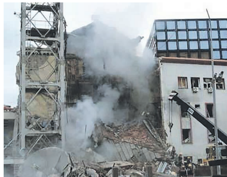
L'immeuble de la Radiotélévision serbe à Belgrade bombardé par l'OTAN en mars 1999.