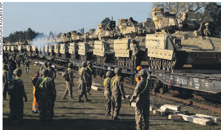
Déchargement de chars américains en Lituanie, en 2019. Un réarmement accéléré par la guerre du Donbass.

La guerre en Ukraine sera peut-être considérée par les historiens du futur comme une des étapes préparatoires d'une guerre généralisée à venir. Un peu comme ce qu'ont été avant la Deuxième Guerre mondiale l'invasion de l'Éthiopie par les troupes de Mussolini ou celle de la Mandchourie par l'armée de l'Empire du Japon, avec la course à l'armement, les mercenaires préparant le