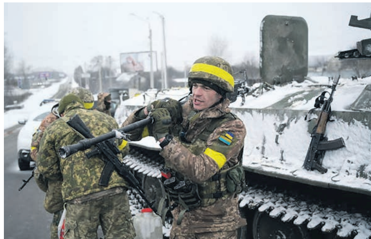
Soldat ukrainien à Kharkiv, en février 2022.

Depuis le début de l'invasion de l'Ukraine par Poutine, les États-Unis et l'OTAN n'ont pas été avares pour livrer des armes à l'Ukraine. Il ne se passe pas une semaine sans qu'une nouvelle enveloppe budgétaire ne soit décidée en faveur de l'État ukrainien.