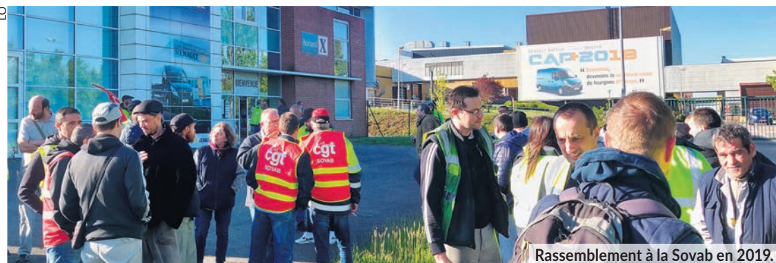
Rassemblement à la Sovab en 2019.