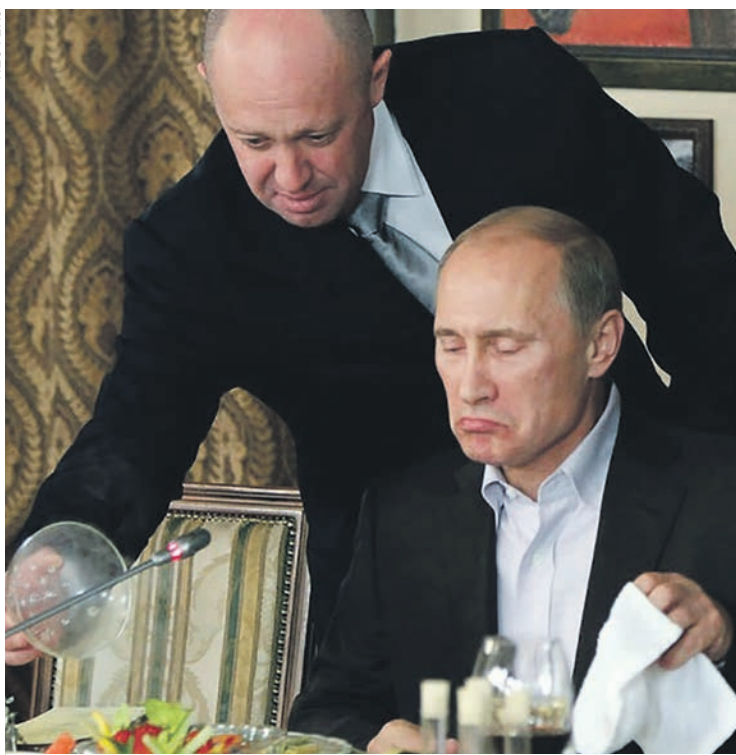
L'oligarque Evgueni Prigojine et Poutine en 2019.