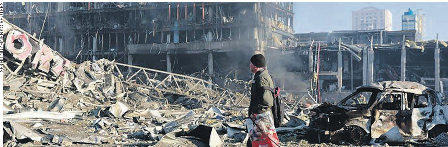
Dans Kiev bombardée.