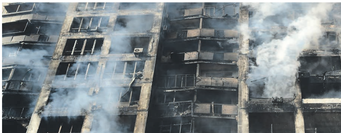
Immeuble bombardé à Svyatoshyno, près de Kiev.

En dénonçant la politique des bolchéviques du temps de Lénine, qui avaient su unir dans un même combat les travailleurs russes et ceux de toutes les nations opprimées auparavant par la monarchie tsariste, à commencer par l'Ukraine, et en prenant pour modèle la politique brutale de Staline en matière de droits des nations, Poutine a renforcé le crédit de l'OTAN, tout