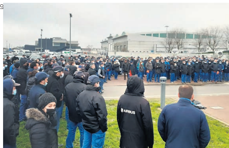
Lors d'un précédent débrayage à Montoir.