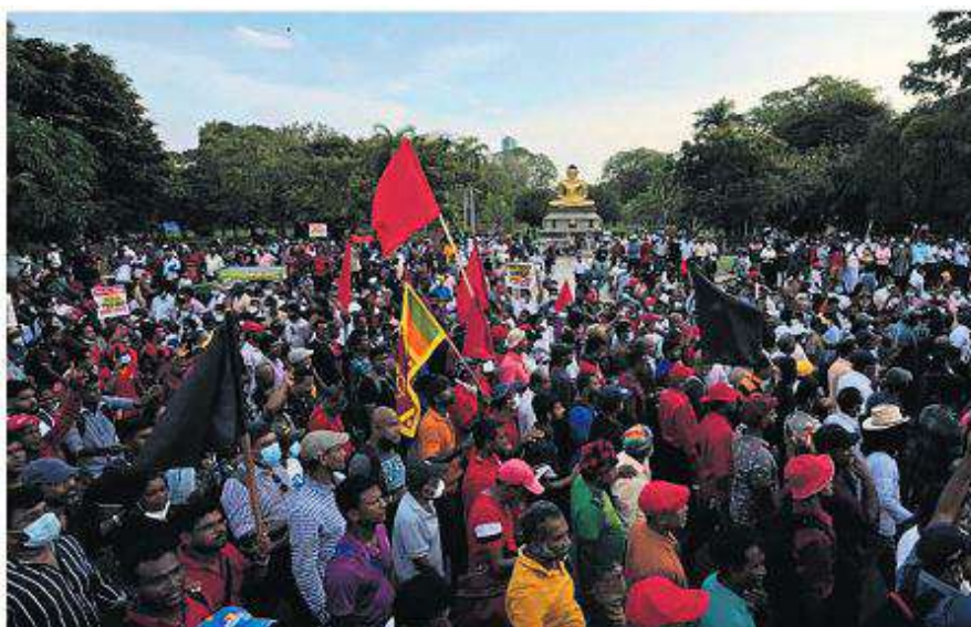
Manifestation anti-gouvernementale le 19 avril 2022.

Le 8 mai, les Rajapaska ont mobilisé leurs partisans, qui ont attaqué les protestataires antigouvernementaux à coups de bâtons, accompagnés par les gaz lacrymogènes de la po-