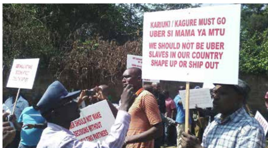
Grève des chauffeurs Uber à Nairobi, au Kenya, face à la baisse du prix des courses. Ils refusent d'être « les esclaves d'Uber » (2 août 2016).

Cela dit, quand Uber ou Deliveroo obligent leurs livreurs à se constituer en microentreprise, c'est pour payer ces travailleurs moins que s'ils les salariaient. Il est évident qu'être