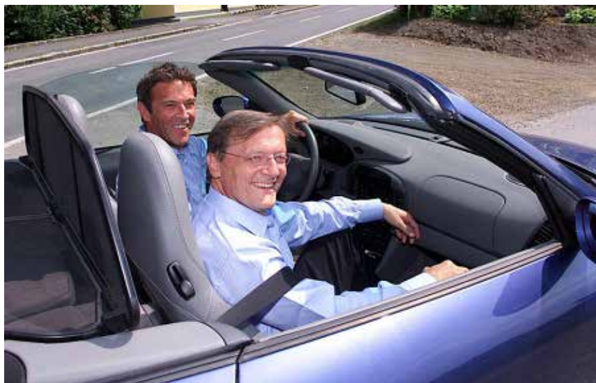
Schuessel, chef du parti conservateur ÖVP, et au volant Haider, chef du parti d'extrême droite FPÖ, dans une Porsche, le 12 juin 2000.

Le KPÖ conserva encore une certaine influence dans les entreprises. Ce fut la répression de l'insurrection ouvrière de 1956 en Hongrie qui lui fit perdre presque tout crédit. Chacun à sa manière, la social-démocratie et le stalinisme avaient ainsi contribué à discréditer, au sein de la classe ouvrière, toute idée de changer la société. Cela conduisit à une rupture profonde avec les traditions militantes existant dans le prolétariat depuis des décennies. En l'absence d'autre perspective, ce fut dès lors le partenariat social, cette collaboration sans faille entre les dirigeants syn-