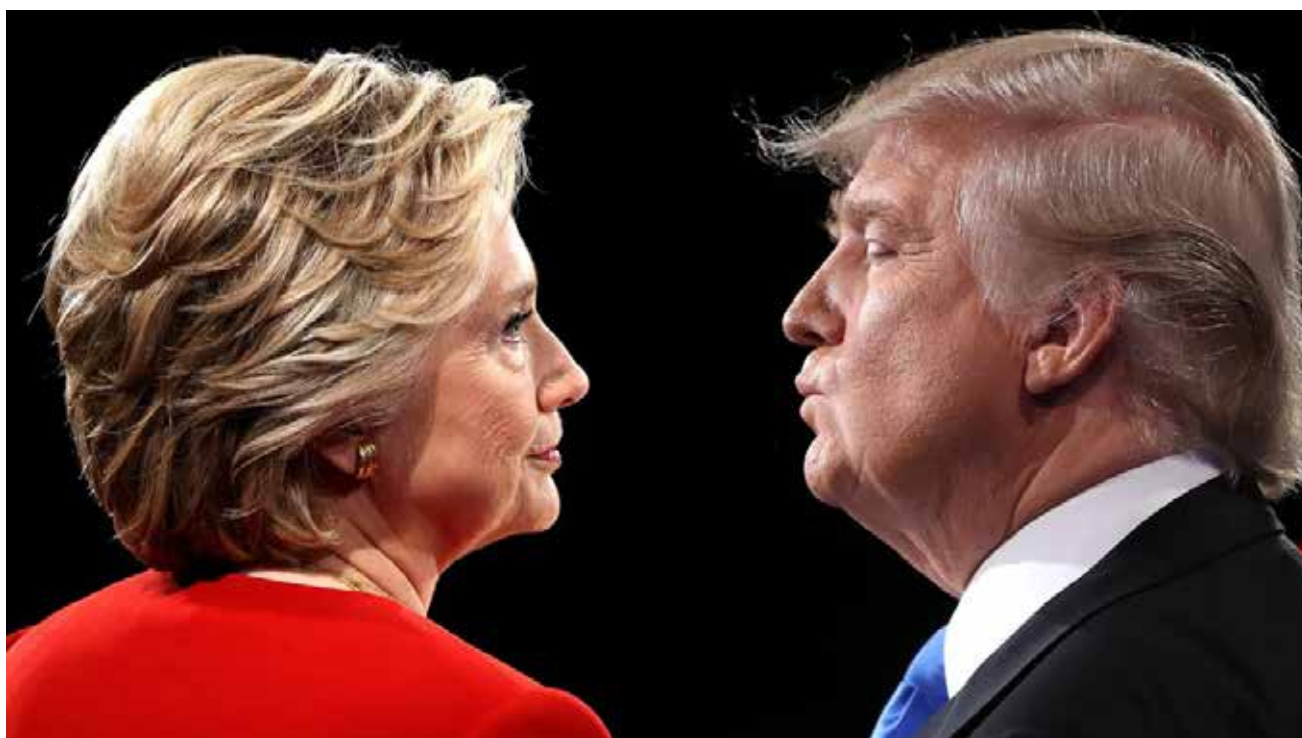
Hillary Clinton et Donald Trump s'affrontent lors des débats télévisés.

Elle est un des éléments qui ont amené au krach des subprimes en 2007-2008. Ainsi les adversaires républicains d'Hillary Clinton ne se sont pas privés ces derniers mois de lui imputer cette catastrophe économique, oubliant juste leur propre responsabilité, tant ces deux partis ont en commun de se plier à la volonté de la bourgeoisie américaine.