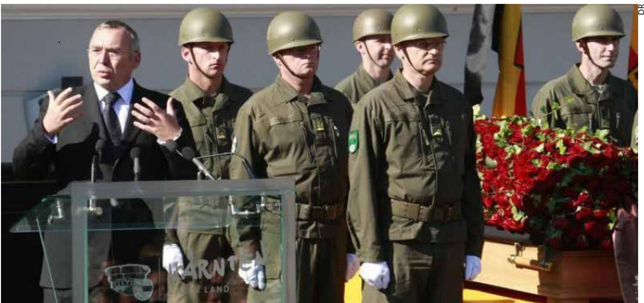
Garde militaire et discours d'hommage du chancelier Gusenbauer, du SPÖ, devant le corps de Haider...

Depuis 2015, le FPÖ participe ainsi à deux gouvernements régionaux : en Haute-Autriche avec l'ÖVP et au Burgenland avec le SPÖ. Comme tous les partis qui ne reculent pas devant la démagogie, le FPÖ est capable de dire tout et son contraire, avec le même aplomb. Il a ainsi fait tour à tour campagne pour et contre l'Union européenne. Et alors qu'il fustigeait, il y a quelques années, l'immigration « criminelle » venue de l'Est, il fait aujourd'hui la cour aux électeurs d'origine serbe, de confession orthodoxe, spéculant sur leur hostilité supposée envers les réfugiés d'aujourd'hui, qui sont principalement de confession musulmane. Car c'est l'arrivée massive des réfugiés dans le pays depuis septembre 2015 qui lui a permis de trouver un nouvel élan.