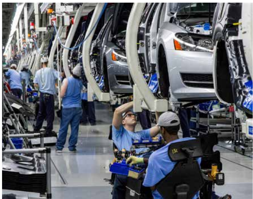
Travailleurs de l'usine Volkswagen de Chattanooga dans le Tennessee.