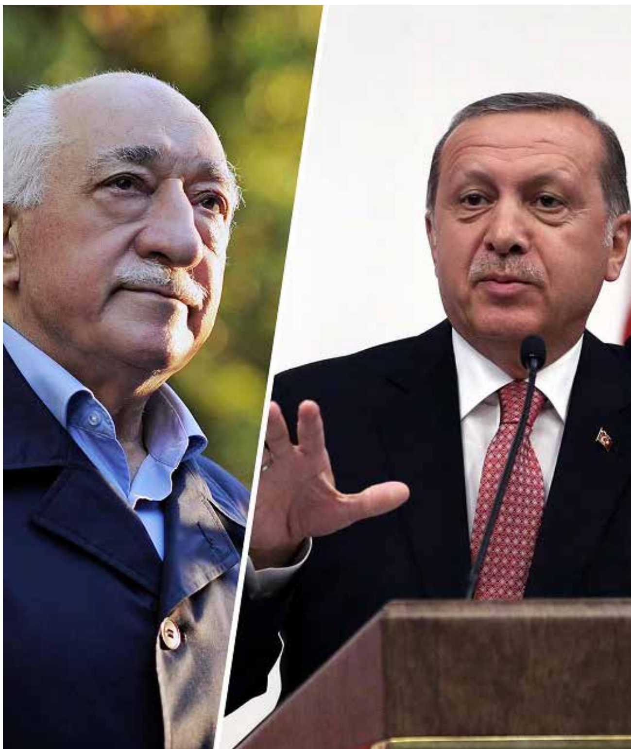
Les frères ennemis : Fethullah Gülen et l'actuel président de la Turquie, Recep Tayyip Erdoğan.