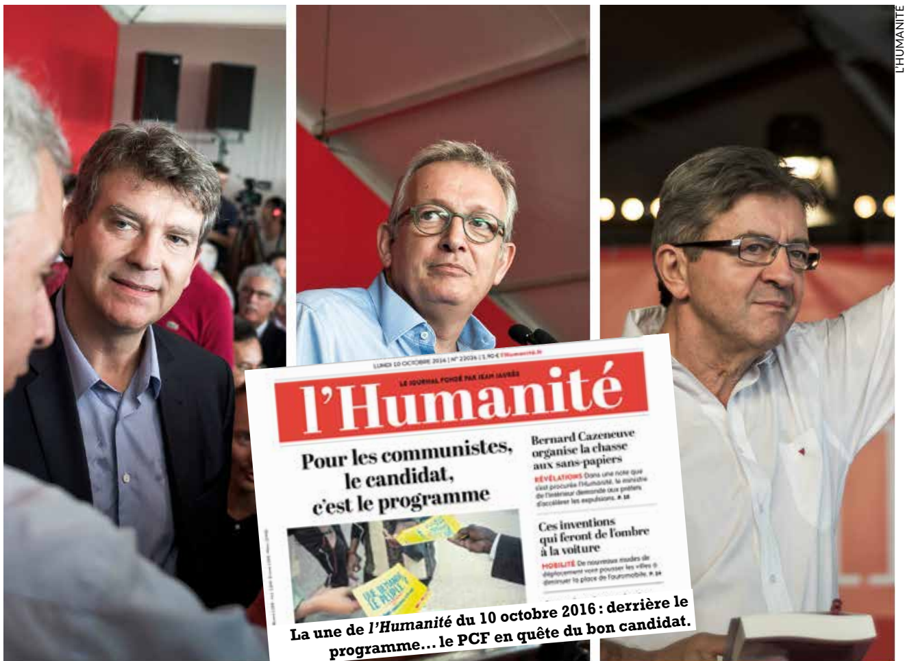
À la fête de l'Humanité 2016 : Pierre Laurent (au centre) hésite entre Montebourg et Mélenchon.