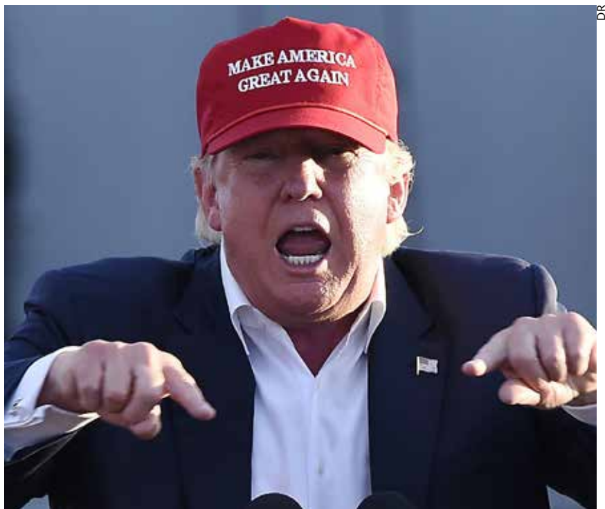
Donald Trump et son slogan de campagne : « Rendre sa grandeur à l'Amérique »

confédération syndicale AFL-CIO de la soutenir.