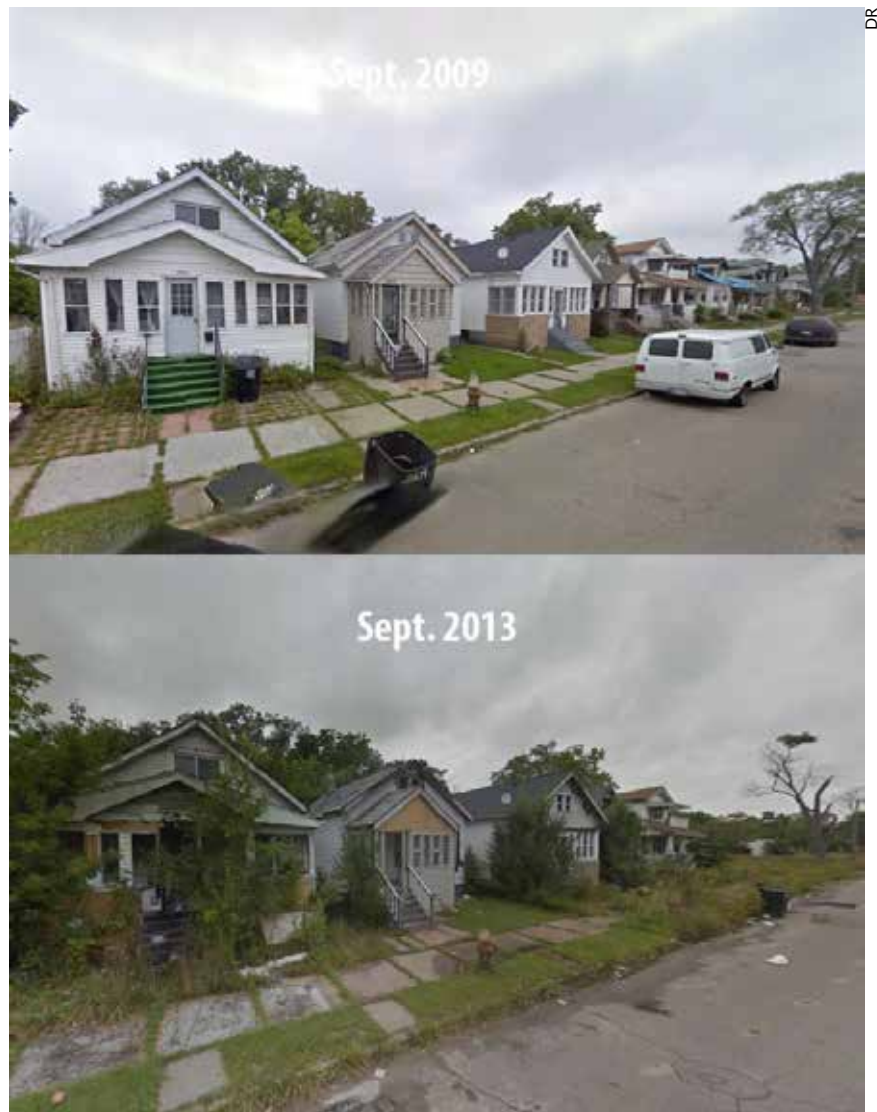
Un quartier de Detroit dévasté par la crise économique.

et particulièrement dans les classes populaires, n'aient aucune confiance en elle? Même dans les rangs démocrates, elle a dû faire face pendant de longs mois à la concurrence de Bernie Sanders, qui a critiqué avec un certain succès le bilan de sa longue carrière... avant de se rallier à elle. Ce qui n'est pas surprenant puisqu'en tant que sénateur Sanders a voté 98 fois sur 100 comme les dirigeants démocrates. Par contre, une partie de ceux qui ont voté Sanders au cours des primaires démocrates ne sont pas prêts à voter Clinton à la présidentielle. Ils ont peut-être eu des illusions dans les discours de gauche de Sanders, mais en ont beaucoup moins dans ceux de Clinton. Cela n'empêche pas la