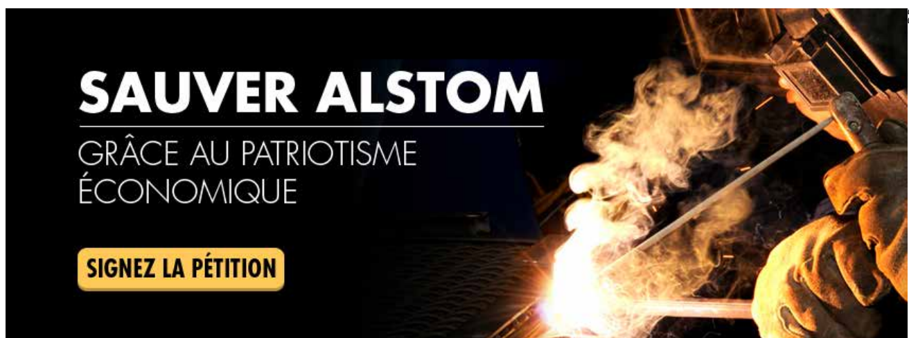
La pétition mise en ligne par le Front national.

Des sites de production fermèrent les uns après les autres et des vagues de licenciements massifs se succédèrent, avec 12 000 suppressions d'emplois en juin 1982, puis 21 000 en