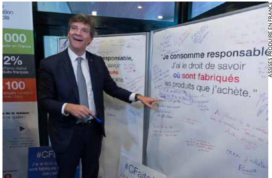
Montebourg aux Assises du produire en France, sur son terrain démagogique préféré.

Le patriotisme économique n'est qu'un aspect de la propagande souverainiste. Il s'accompagne d'une dose de rejet de l'Union européenne, à des degrés qui vont de la sortie pure et simple de l'Union à la dénonciation de ses mauvais traités, en passant par la remise en cause de l'euro. À entendre leurs discours – y compris à gauche – c'est à Bruxelles, aux normes européennes et à tous les organismes supranationaux que l'on doit tous les malheurs, du chômage à la malbouffe, en passant par les coupes claires