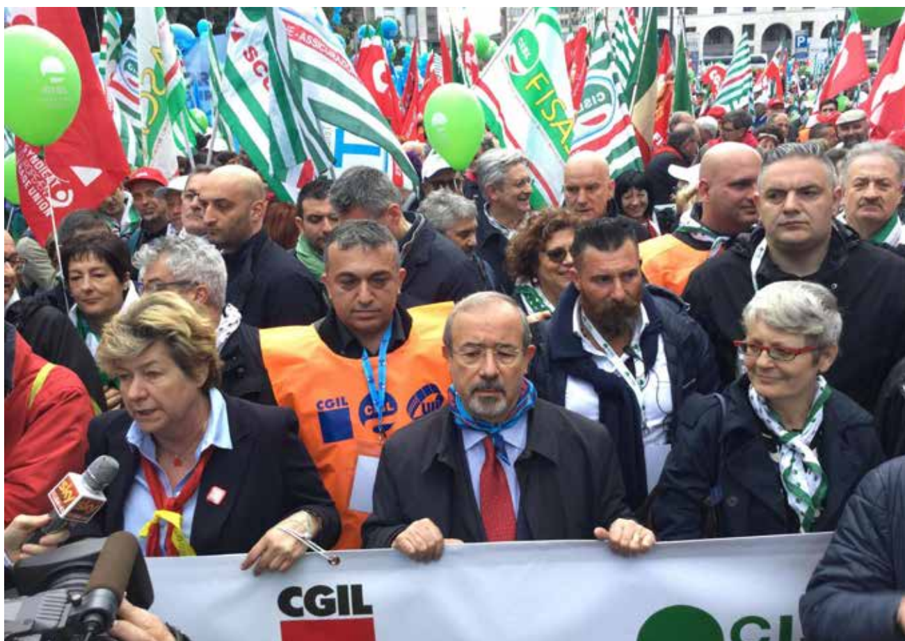
Susanna Camusso, Carmelo Barbagallo et Anna-Maria Furlan le 1 er mai 2016. Les dirigeants de CGIL, UIL et CISL veulent s'assurer le monopole de la représentation syndicale.