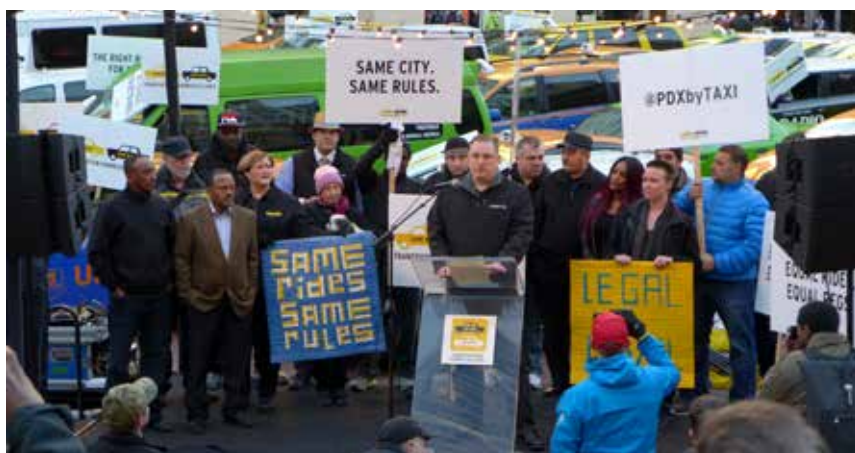
Manifestation de chauffeurs de taxis de Portland dans l'Oregon (États-Unis) contre les VTC Uber : ils demandent les mêmes règles pour tous (janvier 2015).

La grève de sept jours des livreurs de Deliveroo à Londres, en août dernier, en a donné un aperçu. Deliveroo voulait changer leur rémunération. Au lieu de 7 livres de l'heure plus une livre par course, le paiement devait passer uniquement à la course (3,75 livres par commande). Cela aurait renforcé la précarité et diminué leurs revenus, avaient calculé les réfractaires. Plus de cent livreurs (sur 3 000 à Londres) se sont alors déconnectés de l'application. Ils se rassemblaient le