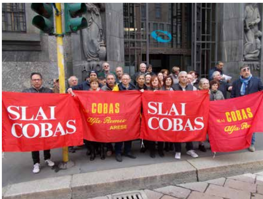
Manifestation du Slai-Cobas, par solidarité avec les licenciés de l'usine Alfa Romeo d'Arese.

Dans le secteur de l'industrie automobile, une expérience importante fut celle des militants de l'usine Alfa Romeo d'Arese, en banlieue milanaise, qui dans leur lutte pour secouer la tutelle des syndicats confédéraux donnèrent vie eux aussi à un syndicat de base. Après certains succès à l'échelle de leur usine, ils lancèrent le Slai-Cobas (Syndicat des travailleurs autoorganisés intercatégoriel Cobas). Il s'agissait pour eux de tenter de généraliser l'expérience de l'usine d'Arese, en proposant aux travailleurs des autres entreprises, à leur