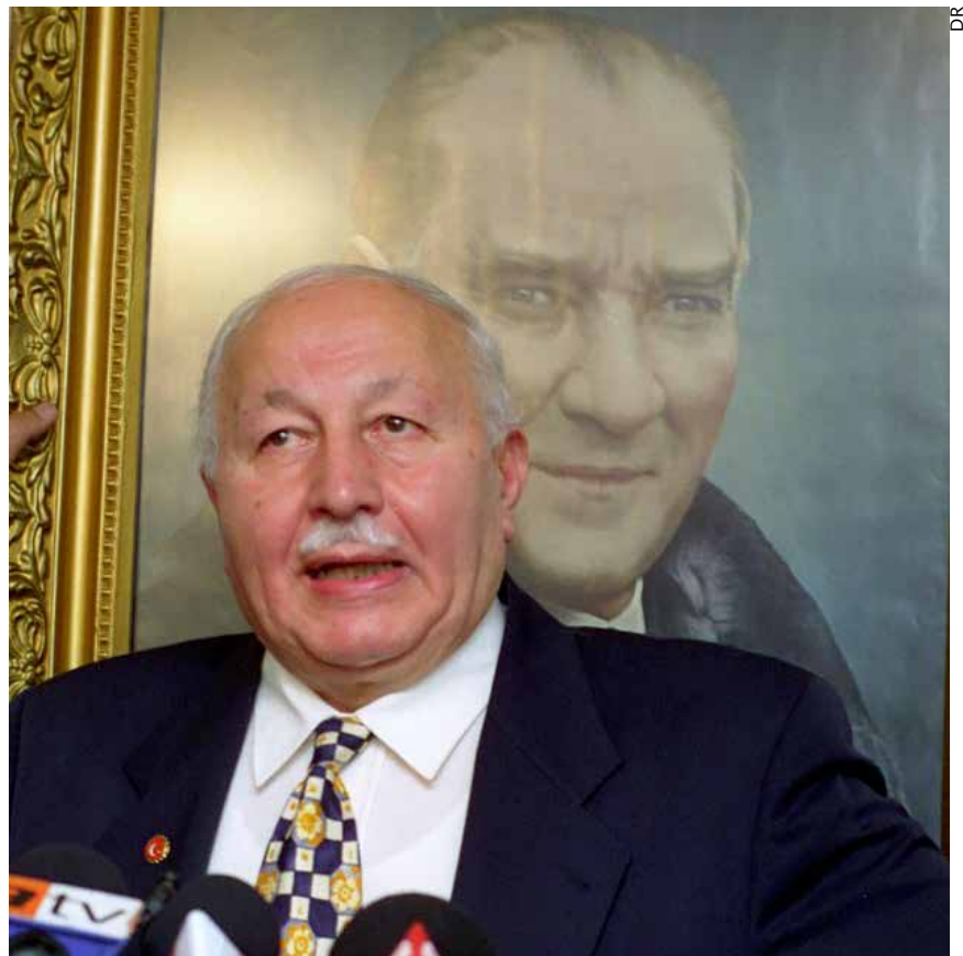
Necmettin Erbakan, fondateur en 1983 du parti islamiste Refah Partisi (le parti du bien-être).

Le conflit éclata au grand jour lorsque le maire de la ville de Sincan, en banlieue d'Ankara, fit adopter une résolution recommandant l'application de la loi islamique, la charia. En guise de coup de semonce, l'armée fit défiler ses chars dans les rues de la ville, le 4 février 1997. Le 28 février, un mémorandum du Conseil national de sécurité