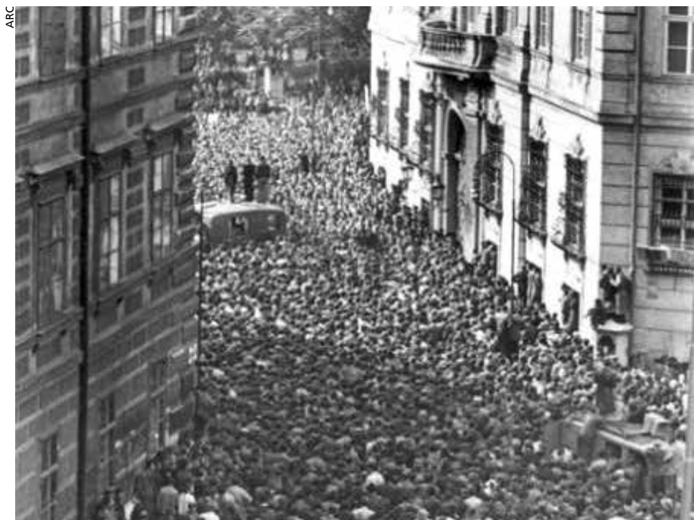
Une manifestation ouvrière en octobre 1950.

Le mécontentement culmina à l'automne 1950, à l'occasion d'un accord sur les salaires, qui se négociait en secret. Commencé fin septembre par des débrayages spontanés dans plusieurs usines de Linz, le mouvement s'étendit rapidement. En deux jours, plus de 200 000 travailleurs se mirent en grève, soit plus de 40 % des salariés de l'industrie. Pour discréditer la grève, le gouvernement inventa le mythe, largement repris par la presse, d'un putsch communiste. Bien qu'au début des années 1950 l'Autriche fût encore partagée entre quatre puissances occupantes, dont l'URSS, c'en était fini de la Sainte-Alliance qui les unissait à la fin de la guerre pour contenir une éventuelle menace prolétarienne. L'impérialisme n'avait plus besoin des services de la bureaucratie