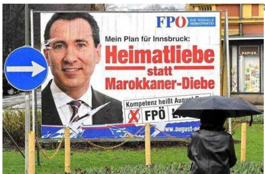
Affiche du FPÖ : « Mon plan pour Innsbruck : l'amour du pays plutôt que les voleurs marocains. »

Lorsque les premiers réfugiés sont arrivés à l'automne 2015, le gouvernement a adopté, à l'instar de la chancelière allemande Angela Merkel, une posture humanitaire. On a ainsi pu voir Heinz Fischer, le président de la République, venir accueillir en personne les réfugiés à la gare de l'Ouest à Vienne, et le gouvernement répéter qu'il ne construirait pas de barrière autour du pays. Puis, à partir de janvier 2016, et à la suite des événements d'Allemagne, il a opéré une volte-face spectaculaire. Dans la nuit du nouvel