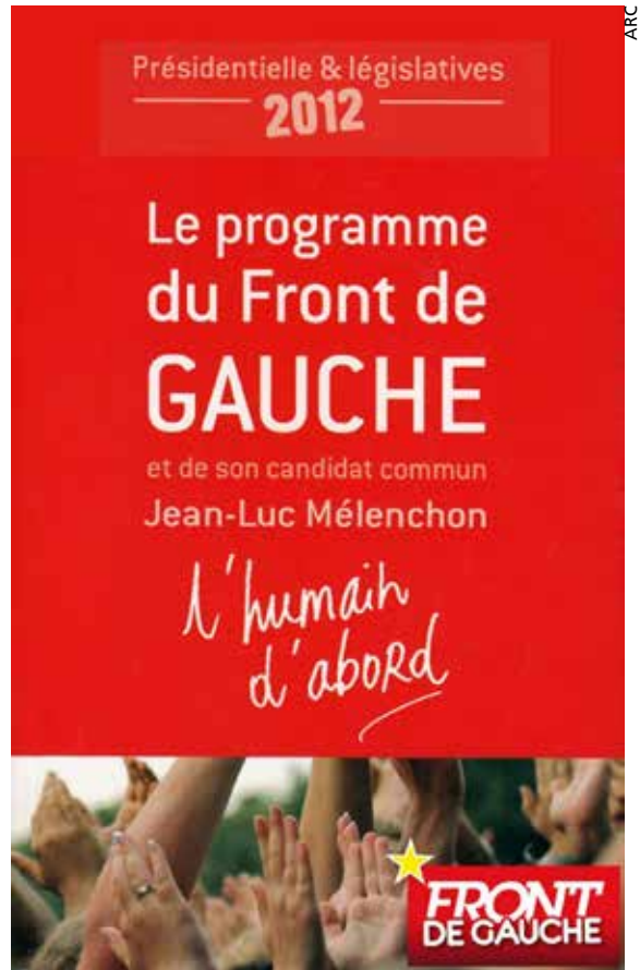
Du programme commun au Front de gauche, le PCF à la remorque d'un politicien bourgeois.