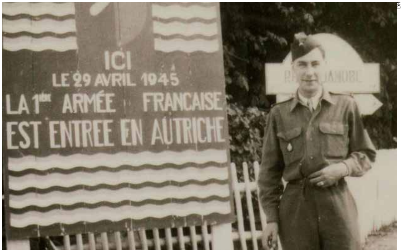
La zone d'occupation française en Autriche.