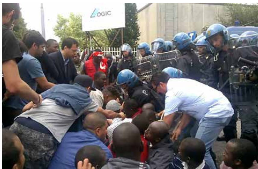
La police contre un piquet de grève, près de Milan.

Le Si-Cobas (Syndicat intercatégoriel - Cobas), formé il y a quelques années à partir d'une scission du Slai-Cobas, a connu un développement numérique relativement important dans le secteur de la logistique, grâce aux luttes conduites par les travailleurs de ce secteur. Les entreprises de la grande distribution ont en effet eu de plus en plus recours, pour leurs opérations de transport et de manutention, à des entreprises de sous-traitance organisées en coopératives, une des formes juridiques privilégiées par la bourgeoisie italienne pour ins-