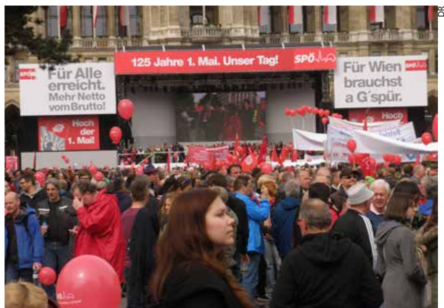
Manifestation du SPÖ, le Premier mai 2015.