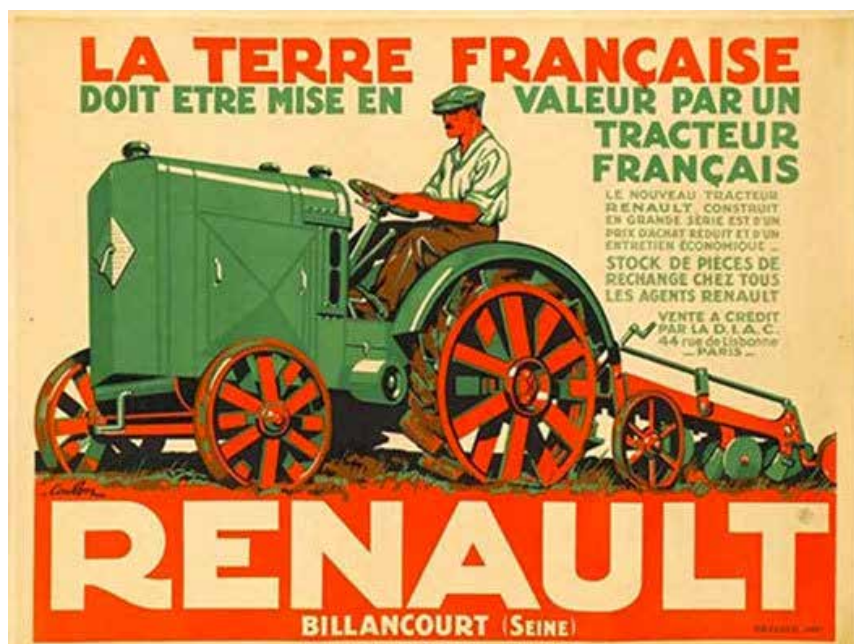
1927 : le patriotisme économique argument de vente : une vieille rengaine !