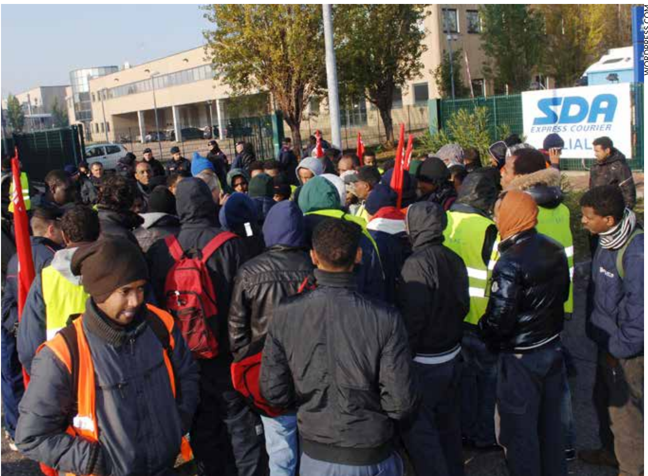
Piquet de grève des travailleurs de la logistique, organisés dans le Si-Cobas.